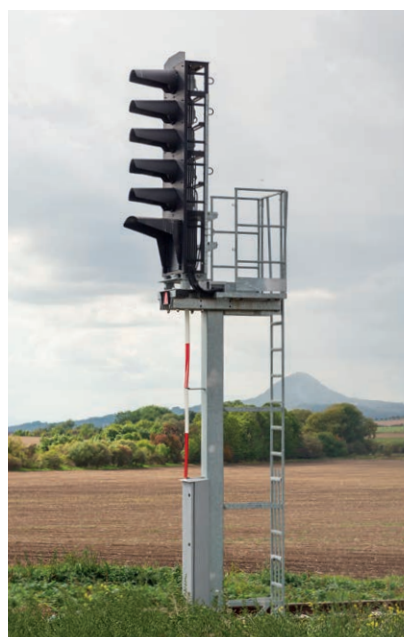
Speciální konstrukce FieldSWing AZD-70 do 250 km/h